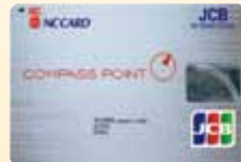
コンパスポイントカード