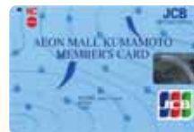
イオンモール熊本カード