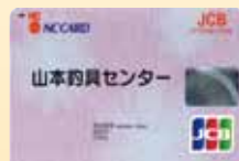
山本釣具センターカード