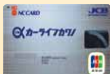
カーライフワノカード